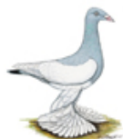
Berliner Langlatschige Tümmeler Isabelfarbig-geelstert