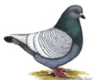
Luchstaube weißschwingig schwarz m.w.Binden