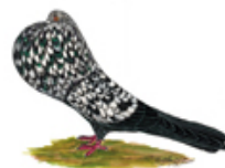
Altdeutsche Kröpfer schwarzgescheckt