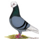
Elbinger Weissköpfe schwarz