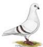
Schöneberger Streifige rotstreifig