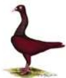
Stargarder Zitterhalse rot/gelb