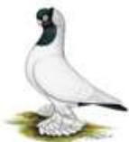
Königsberger Farbenköpfe m.Haube schwarz